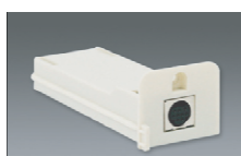
Grabador de chip