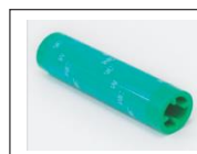
Rodillo de limpieza La caja contiene 4 rodillos