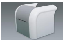
Modulo volteador doblecara