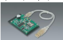
Modulo grabador de Contactless A&B